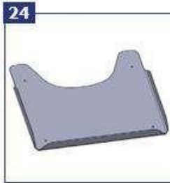
Terapinis padėklas, pilkas