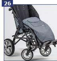
Žieminė apatinės kūno dalies mova