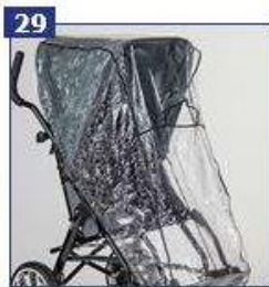
Stogelis su apsauga nuo lietaus