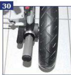
Vežimėlio pavertimo kojėlė