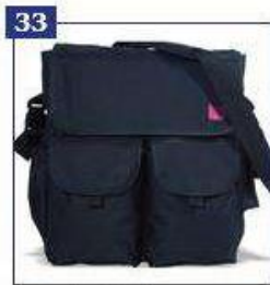
Daiktų ir vystyklių krepšys