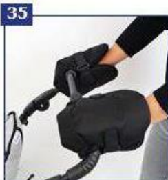
"Cosies" Thermofleece šilta rankų mova palydovui