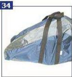
Nailoninis transportavimo krepšys