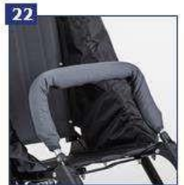
Laikymosi rankena su apmušalais