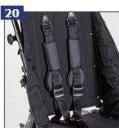
5 tvirtinimo taškų saugos diržas