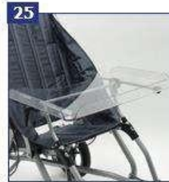
Terapinis padėklas, skaidrus