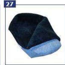
Avies vilnos įdėklas movai