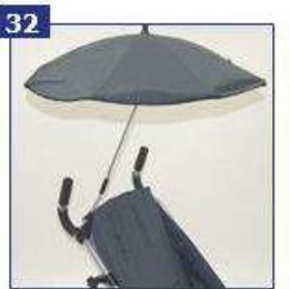
Skėtis nuo saulės