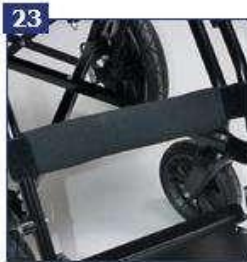
Blauzdos dirželis su apmušalais