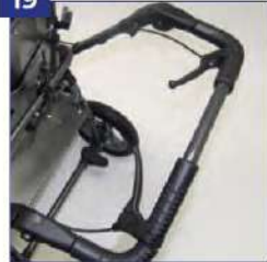
Palydovo valdomi stabdžiai