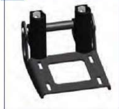
Sustiprintas plieninis pėdų atramos laikiklis