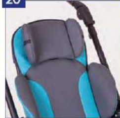
Galvos atramos pagalvėlės, maža versija