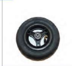
Būginių stabdžių priekiniai ratai su pripučiamomis padangomis