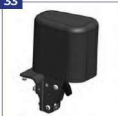
Abdukcijos blokas, atlenkiamas ir nuimamas