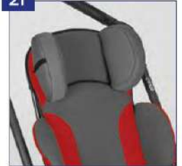
Galvos atramos pagalvėlės