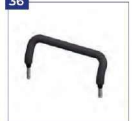
Laikymosi rankena su apmušalais