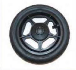
Būginių stabdžių galiniai ratai su pripučiamomis padangomis