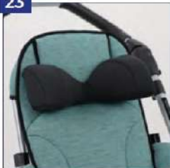
Anatominė kaklo ir galvos atrama