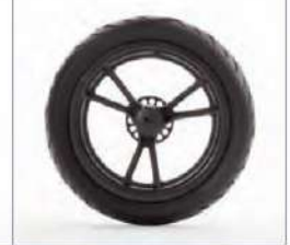
Pilnaviduriai galiniai ratai