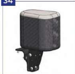
Abdukcijos blokas, fiksuotas