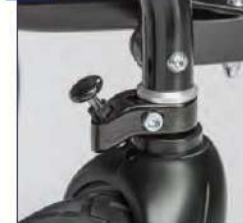
Priekinių ratų šakių pasukimo užraktas