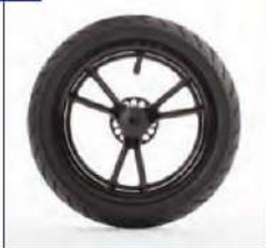
Pripučiami galiniai ratai