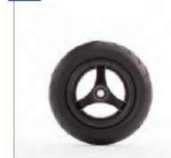
Pilnaviduriai priekiniai ratai