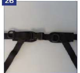
4 tvirtinimo taškų juosmens diržas