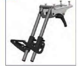
Pakojis, reguliuojamo kampo 85 - 170°