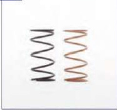
Rėmo pakabos sistema