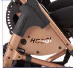
Šoniniai dangteliai, rėmo spakos