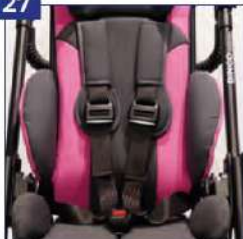
5 tvirtinimo taškų saugos diržai