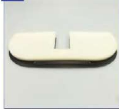
Blauzdos pagalvėles atraminė ploštelė su paminkštinimu