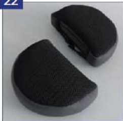
Galvos atramos pagalvėlės su tarpais garsiakalbiams