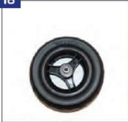
Būgninių stabdžių priekiniai ratai su pilnavidurėmis padangomis