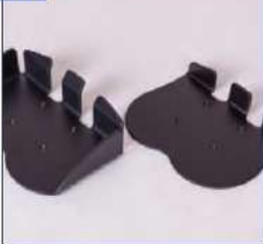
Pėdų ploštelė su kulno atrama arba valties formos ploštelė