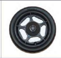
Būgninių stabdžių galiniai ratai su pilnavidurėmis padangomis