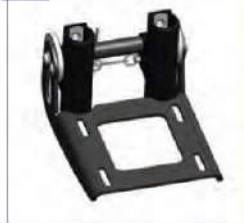
Pėdų atramos atlenkimo užraktas