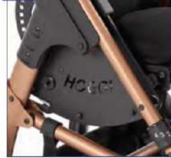
Šoniniai dangteliai, užvalkalų spakos