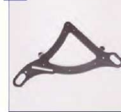
Supakavimo priedai pagal ISO 7176-19