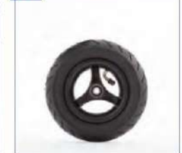
Pripučiami priekiniai ratai